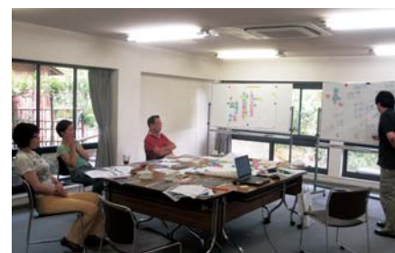
合宿のひとコマ。自然に囲まれた環境は、より素直な言葉を引き出してくれました。

明文化するにあたって、まずキーストーン社員としての仕事への想いをキーワードで出し合い、その想いの総和を文章として紡ぎ出し、