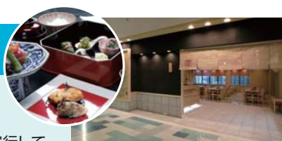
滋賀県草津市でおもてなしいたします。 清元雅苑(きよもと みやびあん) http://www.kiyomoto-miyabian.com/