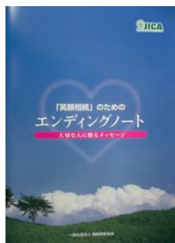
セミナーで使用しているエンディングノート

相続の話をするすると、「うちは財産が無いから大丈夫」と答えが返ってきますが、少ない財産でもめているケースが多いのも現実です。最近では、「身近でもめているケースを見聞きし、準備をしたいが何から始めればいいのか分からない」というご相談も増えてきています。ここ数年書店の棚には多種多様なエンディングノートが並んでおり、容易に手に入ります。「エンディングノート」お勧めします。