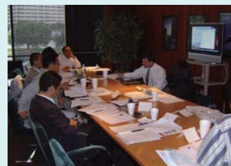
2007年9月米国視察先のFP事務所にて

発足当初は、複数の生命保険会社の商品を扱える立場に変わったということで、様々な生命保険会社の商品知識や特徴の情報共有が主な議題でした。海外視察で「IFA」(=独立系ファイナンシャルアドバイザー)という言葉に触れたメンバーが、「我々の未来の姿はここにあるのではないかと」発言したこと、米国のFP事務所を訪問したのは2007年の夏。これを端緒に、パリ、香港、マレーシア、ハワイ等、訪問先も人脈もどんどんグローバル化しています。そう、出発点はいつもこの会議の場でした。出掛けなくても会議ができる今でも、大事な部分は直接顔を突き合わせ、五感をフル稼働して情報を見極める。8年を超えて続