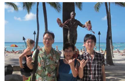
家族はそれぞれ歳を重ねましたがワイキキビーチは 十数年前と同じ光景。