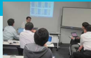
3月の会議は大阪で開催しました。