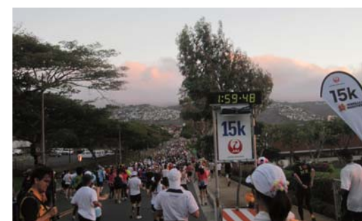
このあたりから見えるハワイ海の日の出は最高でした。

心地よいハワイの風と空気、そして沿道の優しくも力強い声援を全身で感じて、またひとつ感動の体験をすることができました。