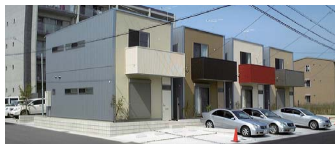
土地約172坪を活用した事例(名古屋市内)

今後の取り組みについては、今のところ家賃が高く設定できるため、相続財産を下げる借入れが必要なくなればいち早く借入れを返済し、将来の賃貸経営の準備を進めることが必要だと感じています。借入れがなければ周りの家賃相場に気にせず入居者を探すことが出来るからです。このような戸建賃貸はこれから増えていく傾向にあります。が、他との差別化した運営方法が必要ではないかと考えています。