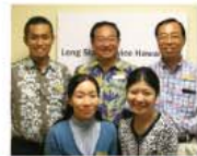
LSHの三田社長(後列中央)とスタッフのみなさん