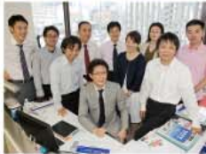
スタッフとともに