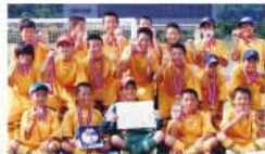
昨年、長男の所属チームが長崎市で3位になりました。

くサッカーをやっており、長男は小学校のチームでキャプテンを務めています。二人とも将来はプレミアリーグでプレーする淡い夢(笑)を持っていますが、夢を語る子供の目はキラキラ輝いていて、微笑ましくもあります。