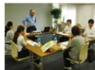
「魔法の質問」セミナーの1コマ

テーマ毎に8つの質問が用意され、参加者は各質問に30秒で答えを記入し、発表していただきます。今回のテーマは「生きがい」「健康」「お金」の3つ。30秒出てくる答えはほぼ直感。だからこそ、「自分の心に本当にある考えしか浮かんでこないし」「答えに正解も間違いもない」。参加の皆様からは「30秒で答えられるかなと不安だったけど、意外にスラスラ書いて驚いた」「とっさに答えが思い浮かばず、