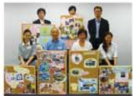
素晴らしい宝地図が勢ぞろい