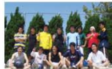
前右から2番目が筆者

今年41歳の私、未だサッカーというスポーツを観戦するのではなく、プレーする事に喜びを感じております。10歳からボールを蹴り始めて小・中・高・大