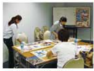
ただ今、宝地図作成中！

このセミナーでは参加者の皆様に事前準備をお願いしました。「ご自分の夢や希望を表現した写真や雑誌の切抜き等を持ってきてください」。ポイントは「普段から必要な情報をキャッチするためのアンテナを張り巡らしているか」。当日は持参いただいたものをA1サイズのコルクボードに自由に貼っていただきました。「休憩しながら作成してくださいね」そんな講師の声が全く届かないほどのスゴイ集中ぶり！「持ち帰ってパートナーと一緒にもっと作り込んでいきたい」という声をいただく等、改めて人生におけるパートナーの重要性を感じました。